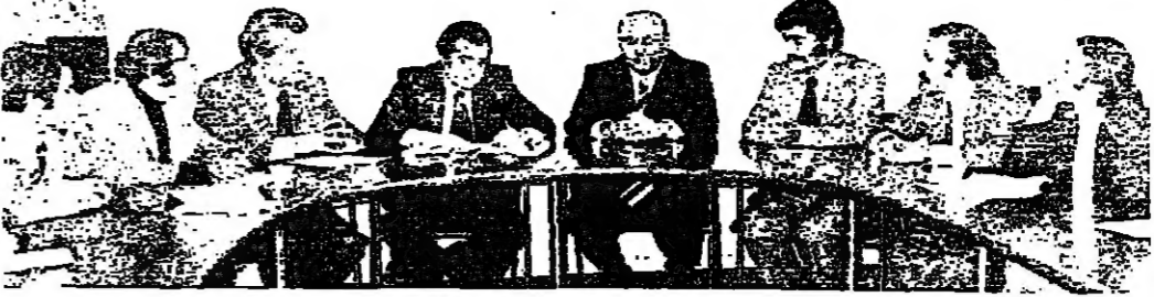
اجتماع في وزارة العمل بين الوزير نديم نعيم ، ووزير التربية ماجد حمادة ، ووفد المعلمين المضربين

الساعة التاسعة والنصف من صباح اليوم ، بتحقيق مطالب المعلمين . ومن جهة ثانية، دعت نقابة اصحاب الثانوية الخاصة الى جمعية صوبية طارئة يوم غد السبت في الساعة التاسعة مساءً بتأدية اثن التساؤلات الجديدة لدرس الوضع التربوي الراهن . ورقت « الانوار » رسالة من ادارة مدرسة الاخوة الجديدة في الرجعة - سقي الحدث اوضحت فيها ما يلي : ان مدرسة الاخوة الجديدة تحترم الحقة ، والتفاني وتؤيد جميع المطالب الحقة ، ولم تلجأ الى اي تدبير تعسفي بطرد اي من افراد الهيئة التدريسية الضرية بل هي شامطة بطلبها البعض للتعرض للاضراب لاقراري شخصية .